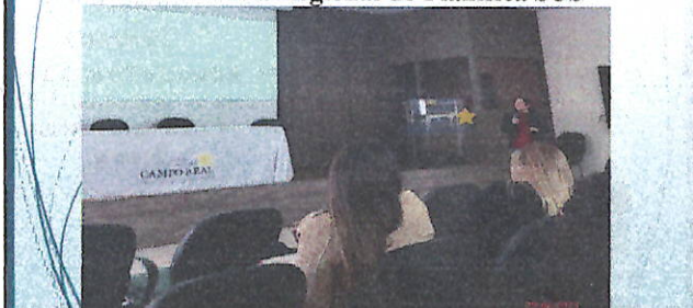
Apresentação do Núcleo de Segurança do Paciente Oficina Regional do Planifica SUS