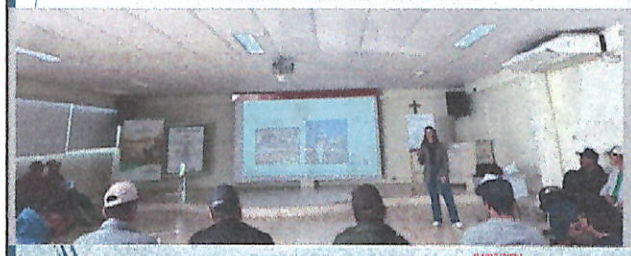
Ação Educativa - Vigilância da Saúde do Trabalhador e Segurança em Operações das Unidades de Armazenamento de Grãos